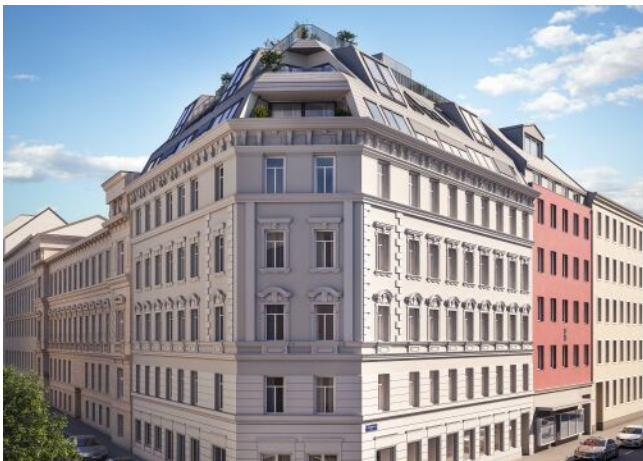
Vivienne | Fassade Tag