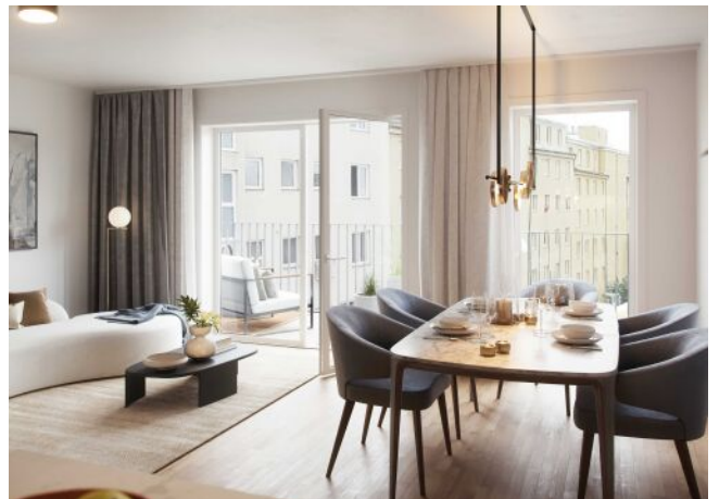
Wiedner Hauptstrasse 140 | Wohnraum