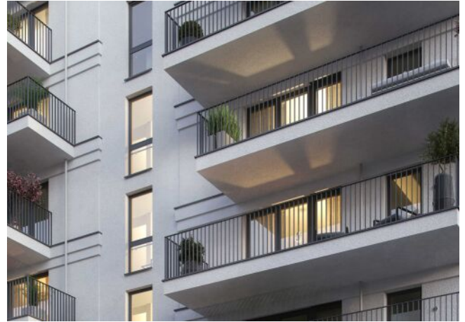
Wiedner Hauptstrasse 140 | Fassade Straße