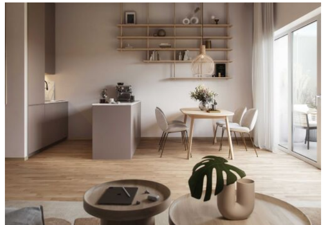
Wiedner Hauptstrasse 140 | Wohnraum