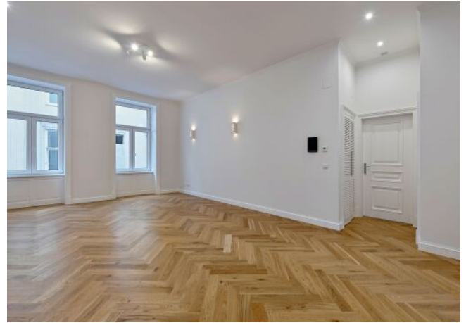
Beispielfoto nach Sanierung