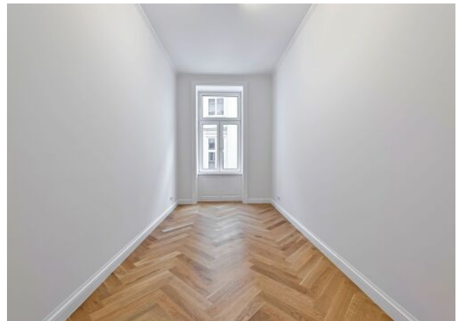
Beispielfoto nach Sanierung