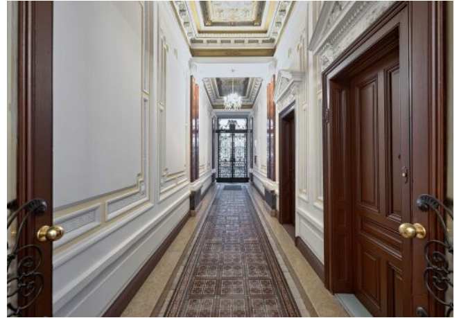
Lindengasse 25 | Hauseingang