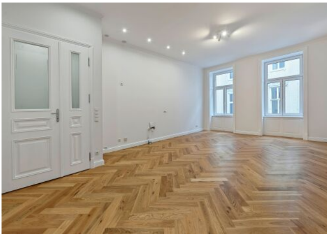
Beispielfoto nach Sanierung