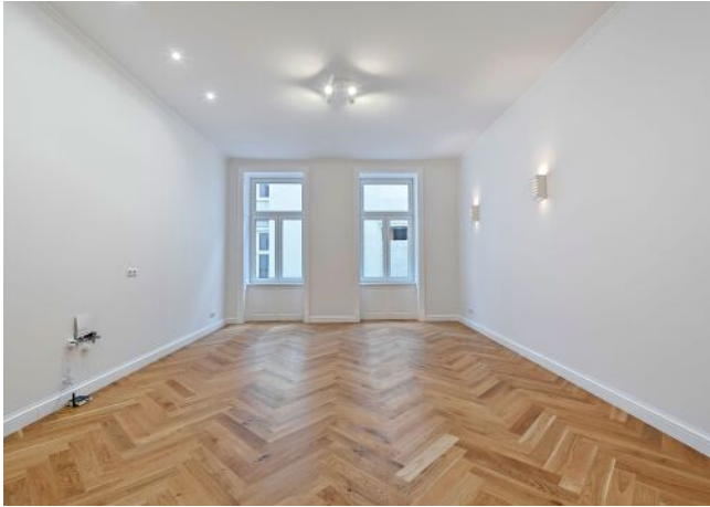
Beispielfoto nach Sanierung