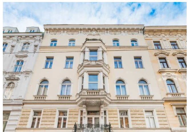
Lindengasse 25 | Fassade