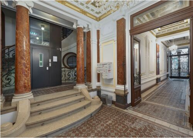
Lindengasse 25 | Hauseingang