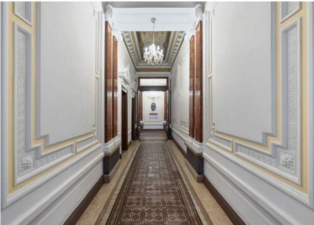
Lindengasse 25 | Hauseingang