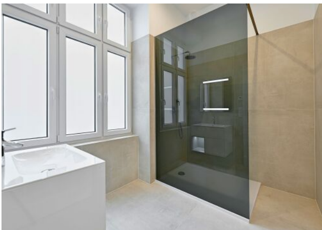
Beispielfoto nach Sanierung