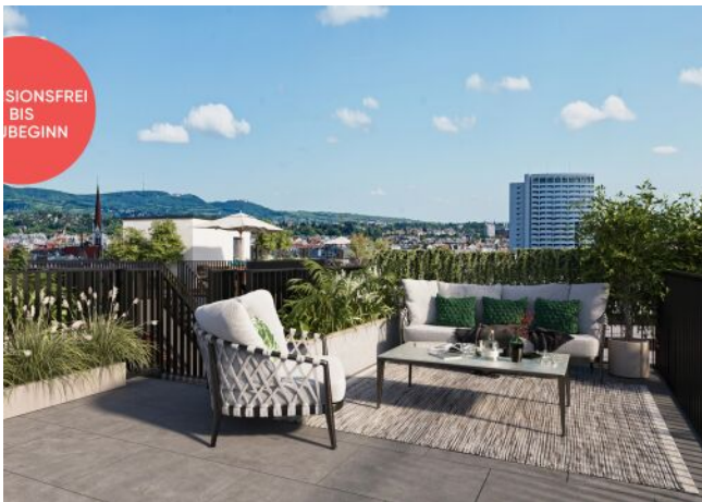
Roseggergasse | Dachterrasse