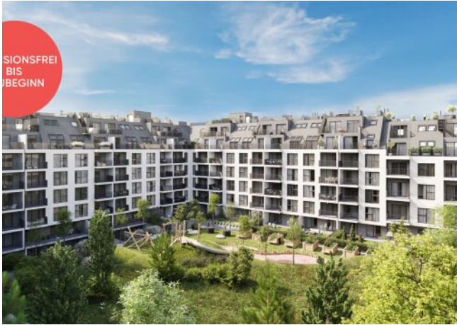
Roseggergasse | Hof Tag