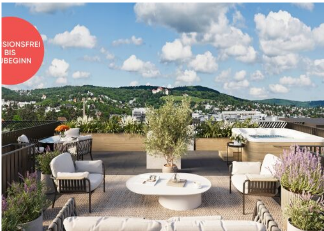
Roseggergasse | Dachterrasse