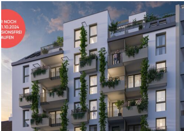
Ottakringer Straße 26 | Straßenansicht