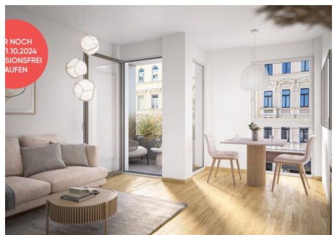
Ottakringer Straße 26 | Wohnraum