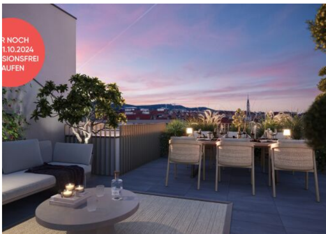
Ottakringer Straße 26 | Dachterrasse