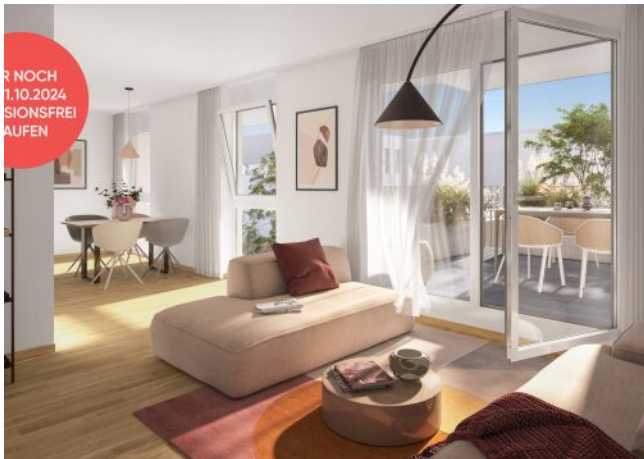
Ottakringer Straße 26 | Wohnzimmer