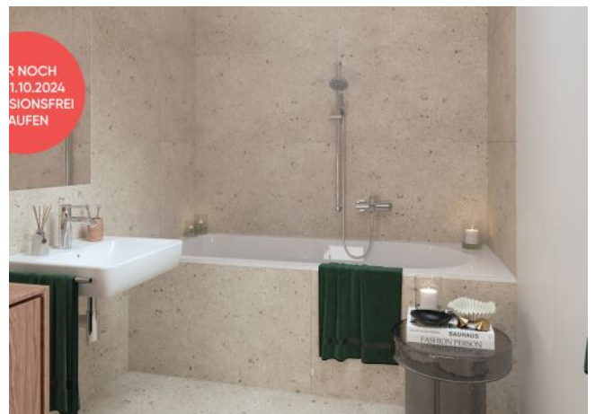
Ottakringer Straße 26 | Badezimmer