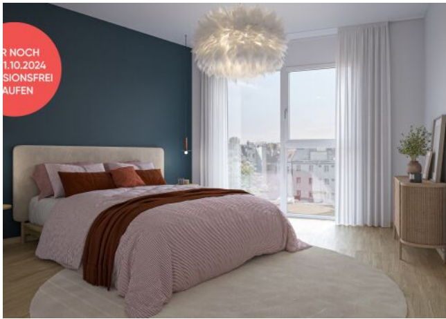
Ottakringer Straße 26 | Schlafzimmer