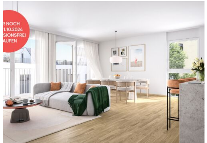
Ottakringer Straße 26 | Wohnzimmer