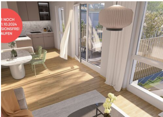
Ottakringer Straße 26 | Wohnraum