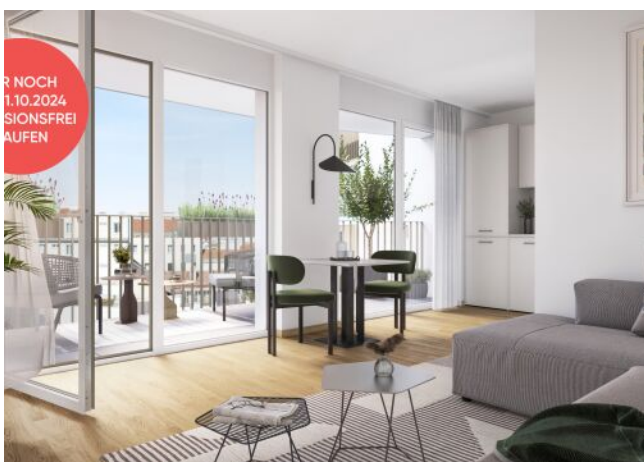
Ottakringer Straße 26 | Wohnzimmer