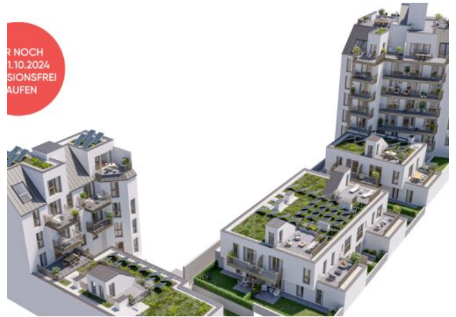
Ottakringer Straße 26 | Vogelperspektive