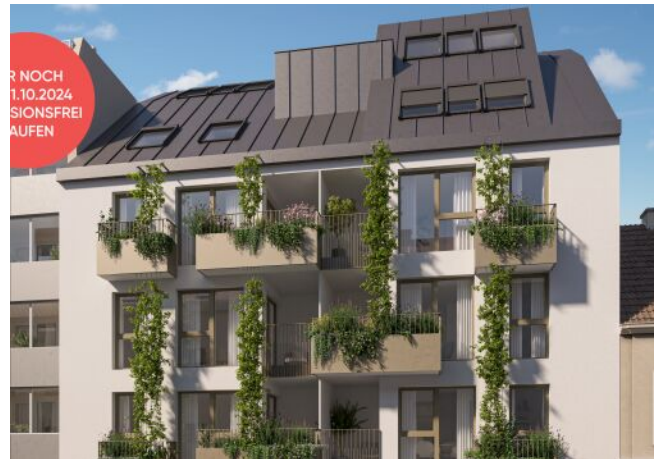
Veronikagasse 31 | Fassade