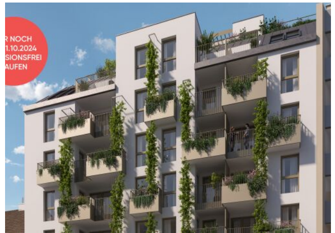
Ottakringer Straße 26 | Fassade