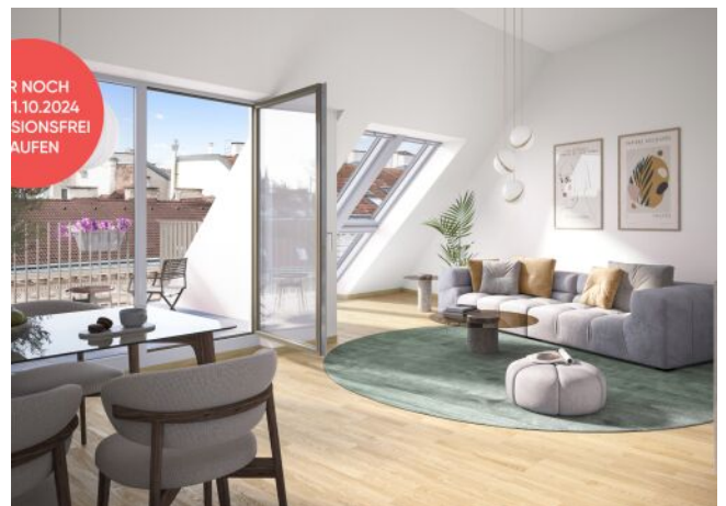
Ottakringer Straße 26 | Lebensraum