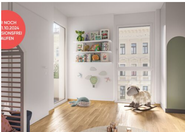
Ottakringer Straße 26 | Kinderzimmer