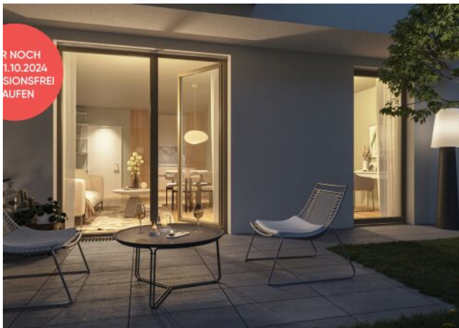
Ottakringer Straße 26 | Gartenwohnung