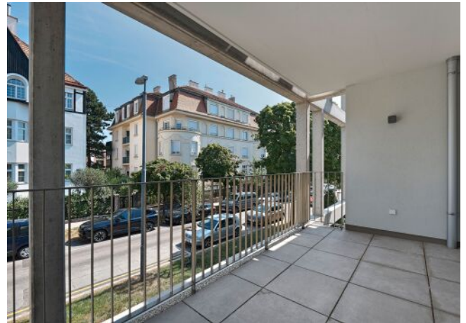
Greenhill Suites | Balkon