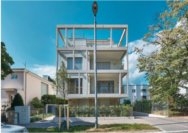
Greenhill Suites | Fassade