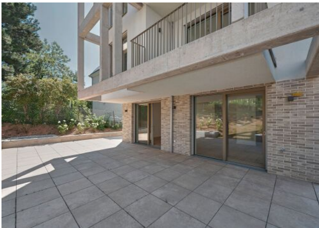
Greenhill Suites | Fassade