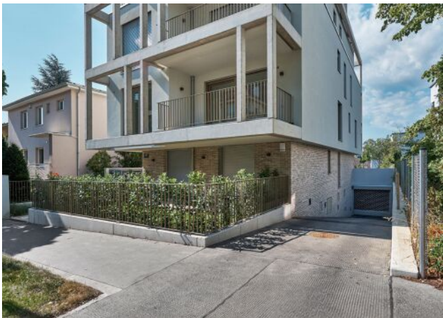
Greenhill Suites | Fassade