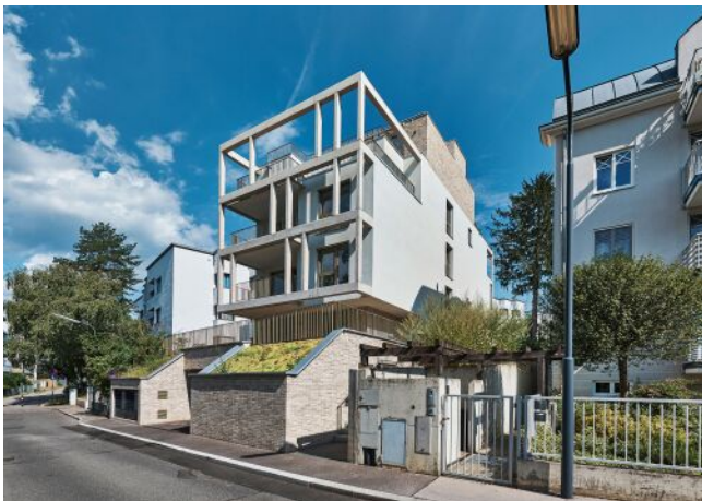
Greenhill Suites | Fassade