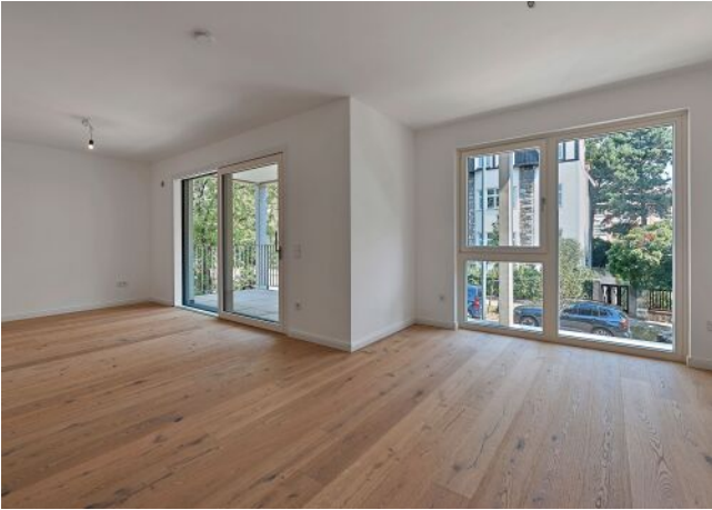
Greenhill Suites | Wohnraum