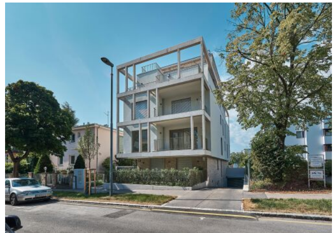
Greenhill Suites | Fassade