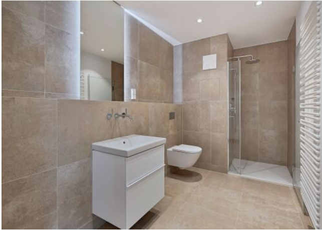
Greenhill Suites | Badezimmer