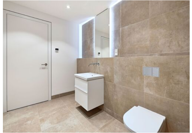
Greenhill Suites | Badezimmer