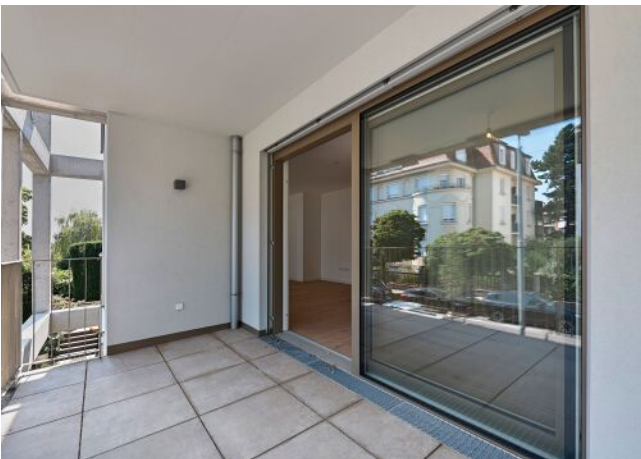
Greenhill Suites | Balkon