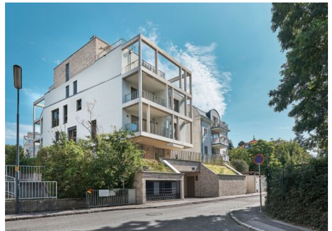
Greenhill Suites | Fassade