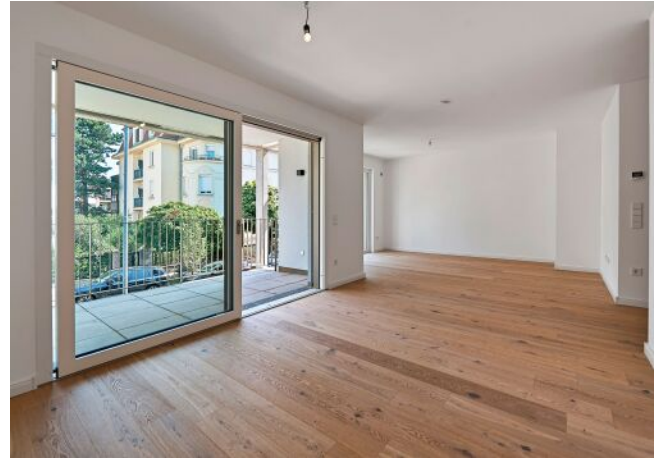
Greenhill Suites | Wohnraum