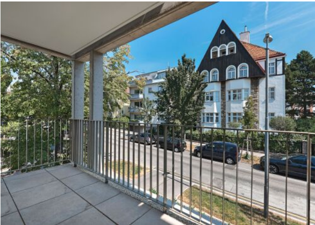
Greenhill Suites | Balkon