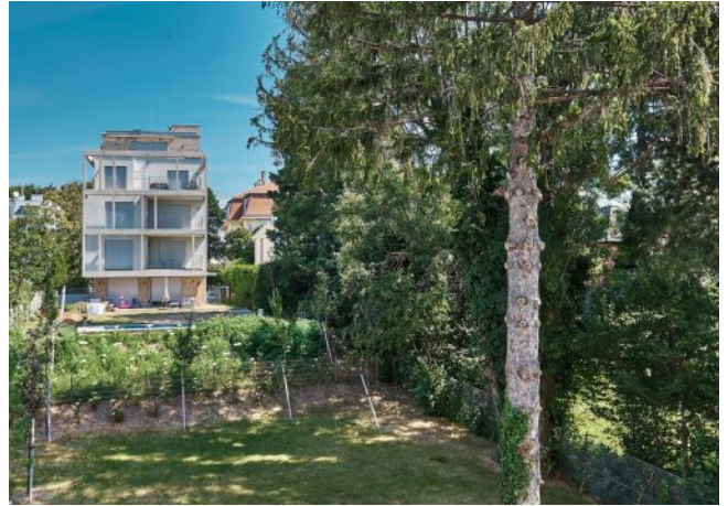
Greenhill Suites | Grünruhelage