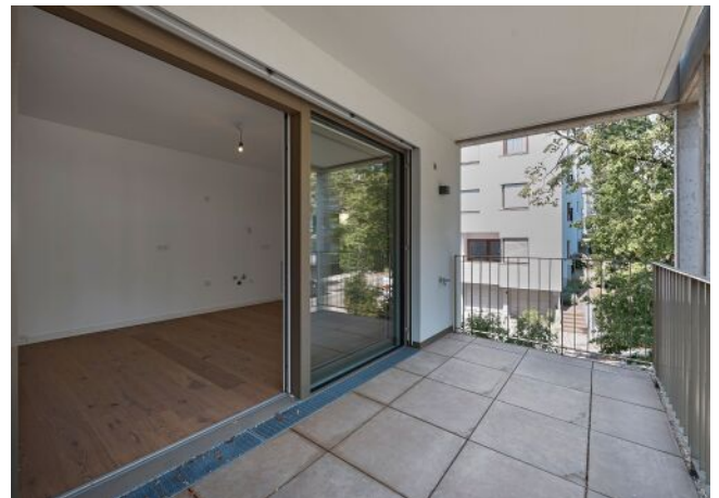
Greenhill Suites | Balkon