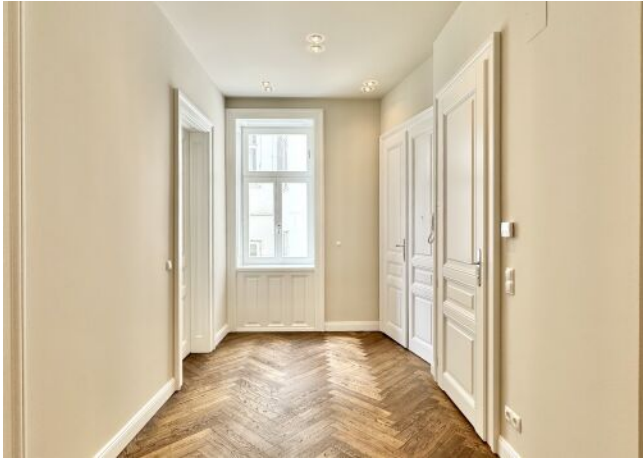
Vorraum mit Fenster