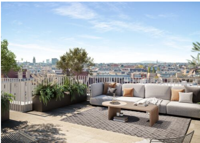
Schumannngasse | Dachterrasse