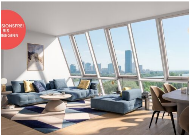
TRAISENGASSE | Penthouse Donaublick