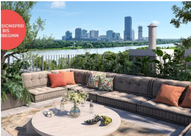
TRAISENGASSE | Dachterrasse Donaublick