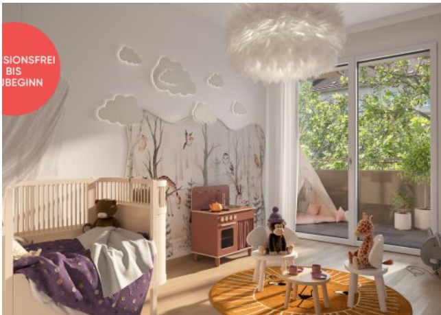
TRAISENGASSE | Kinderzimmer