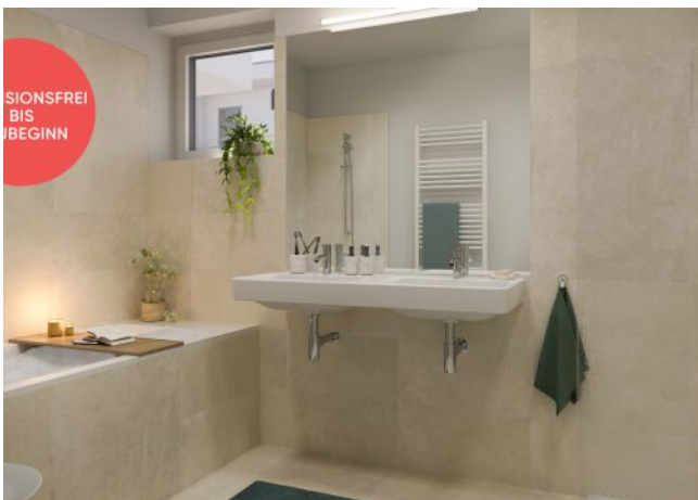
TRAISENGASSE | Badezimmer