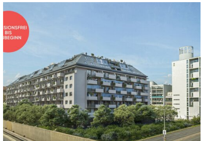
Traisengasse | Eigentum mit Donaublick