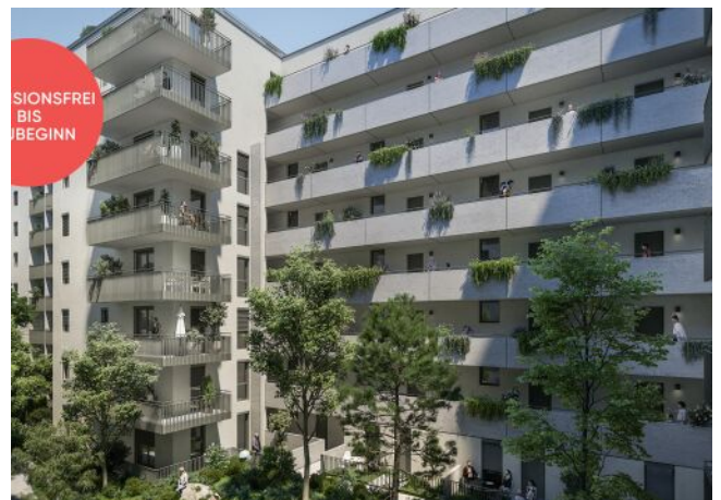
TRAISENGASSE | Innenhof-Ruheoase