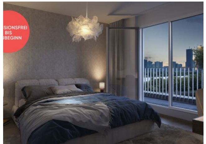
TRAISENGASSE | Schlafzimmer