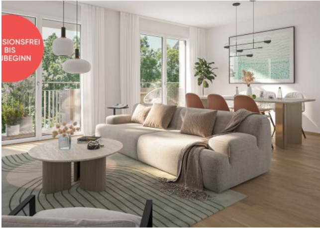
TRAISENGASSE | Lebensraum