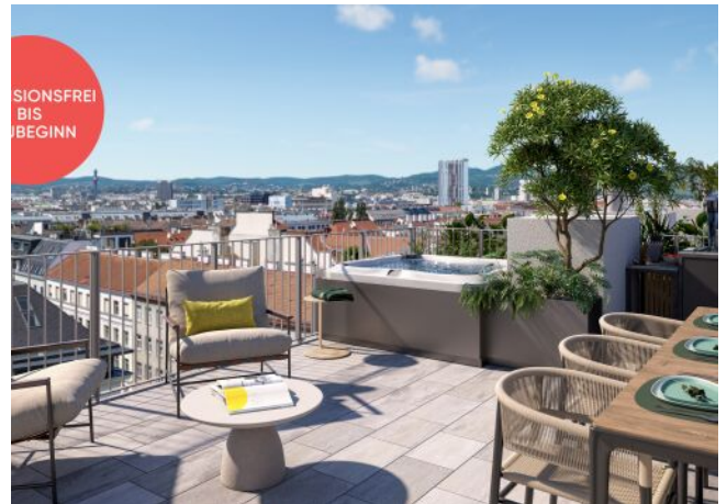
TRAISENGASSE | Dachterrasse mit Stadtblick