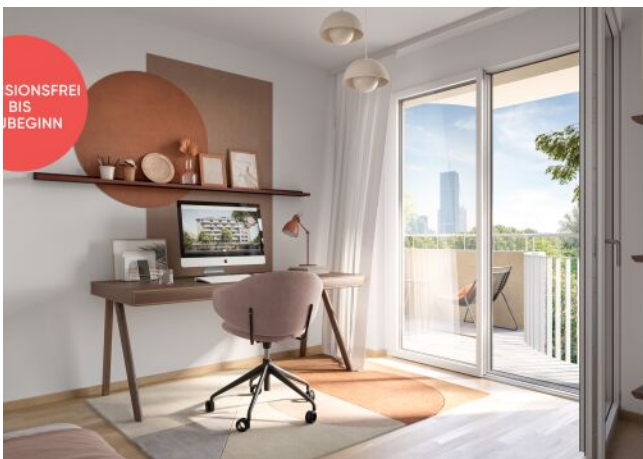
TRAISENGASSE | Home Office