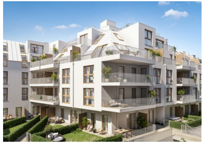
Schumannngasse | Fassade Nord