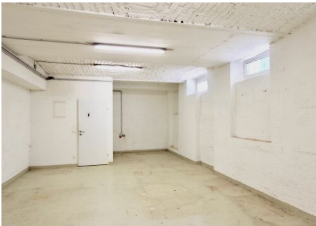
Atelier / Werkstatt