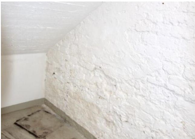
Atelier / Werkstatt