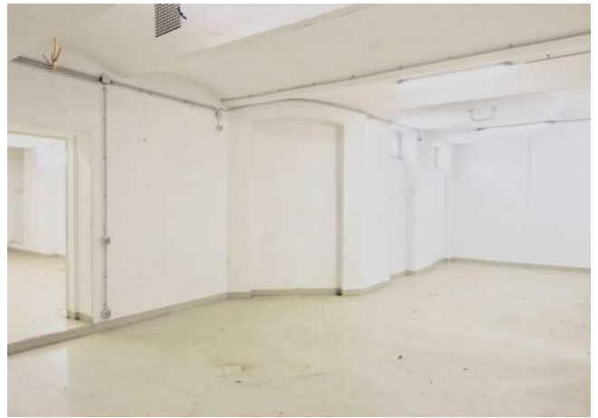
Atelier / Werkstatt