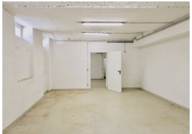
Atelier / Werkstatt