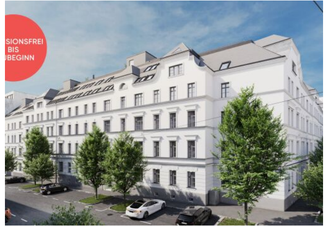
Roseggergasse | Fassade Tag