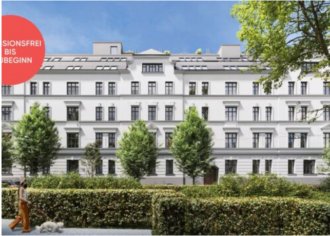
Roseggergasse | Fassade Frontal