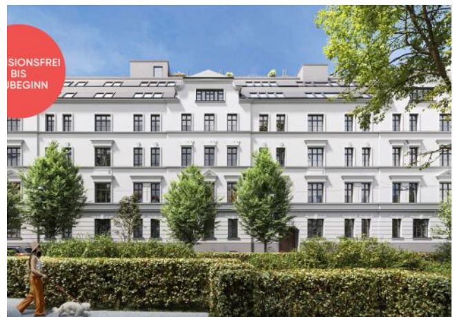
Roseggergasse | Fassade Frontal