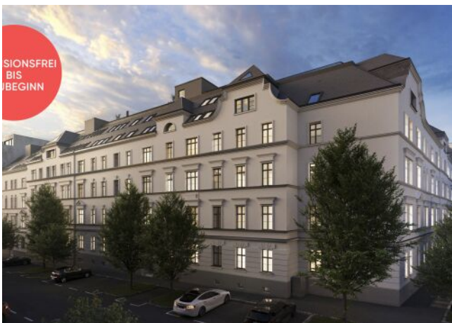
Roseggergasse | Fassade Abend