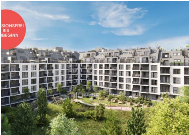
Roseggergasse | Hof Tag