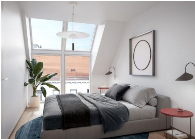
Schumannngasse | Schlafzimmer