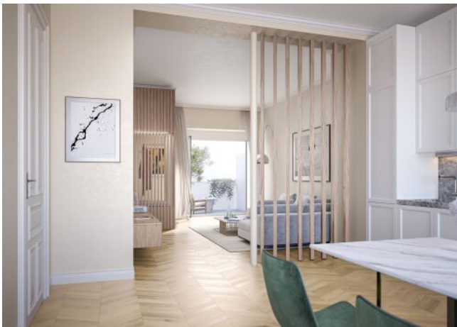
Essenz No. 1 | Wohnraum Regelgeschoss