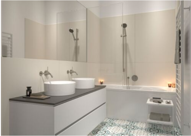
Essenz No. 1 | Badezimmer Regelgeschoss