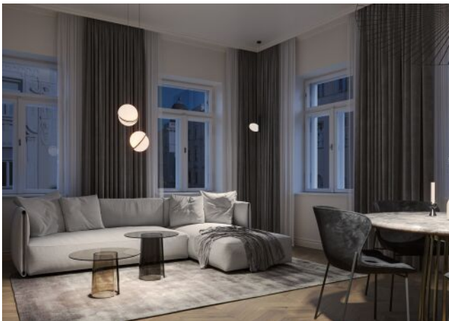
Essenz No. 1 | Wohnraum Regelgeschoss