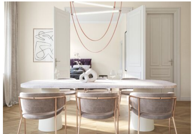
Essenz No. 1 | Wohnraum Regelgeschoss