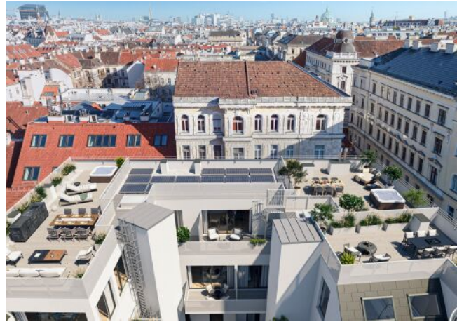
Essenz No. 1 | Hof