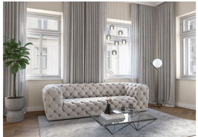
Essenz No. 1 | Wohnraum Regelgeschoss