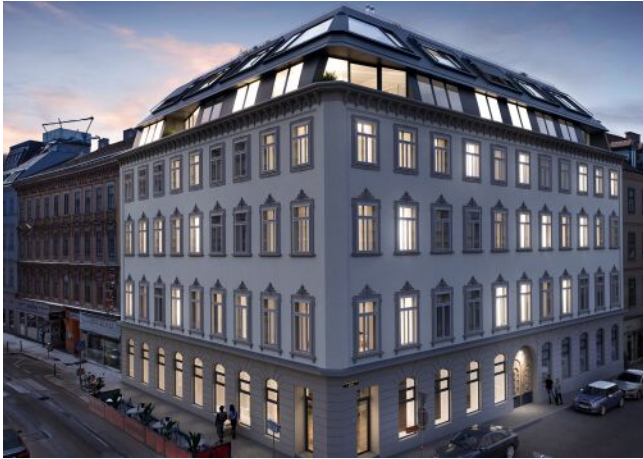
Essenz No. 1 | Fassade Abend