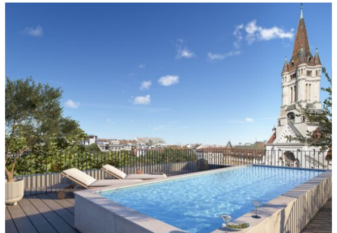
The Legacy | Dachterrasse Pool