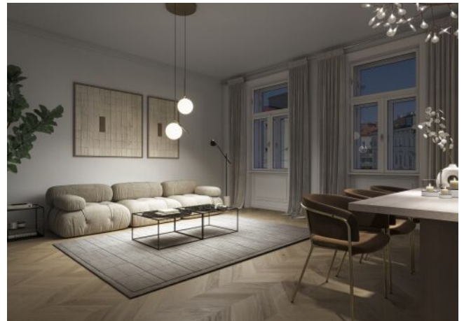
The Legacy | Wohnraum Regelgeschoss