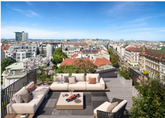
The Legacy | Dachterrasse