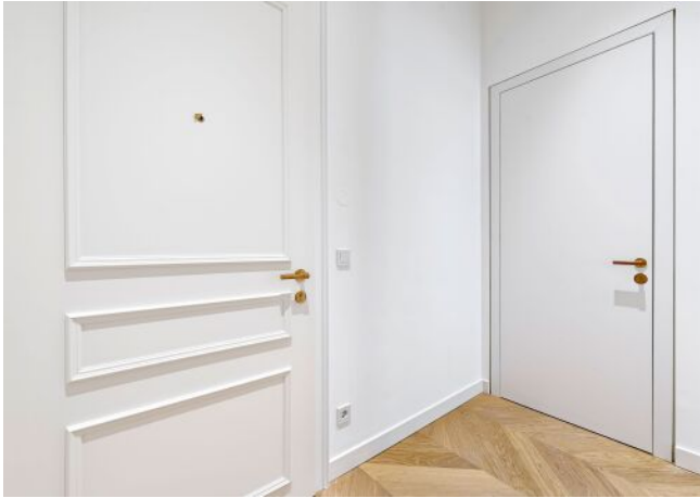
The Fusion | Vorraum