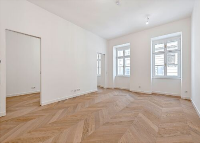
The Fusion | Wohnraum