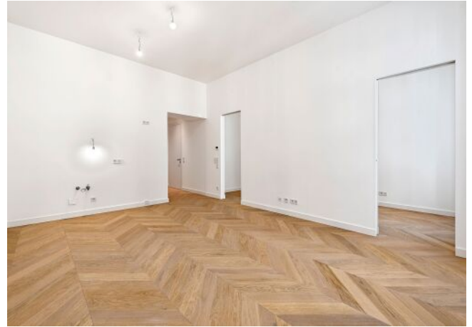
The Fusion | Wohnraum