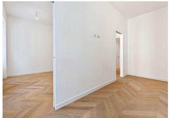
The Fusion | Zimmer