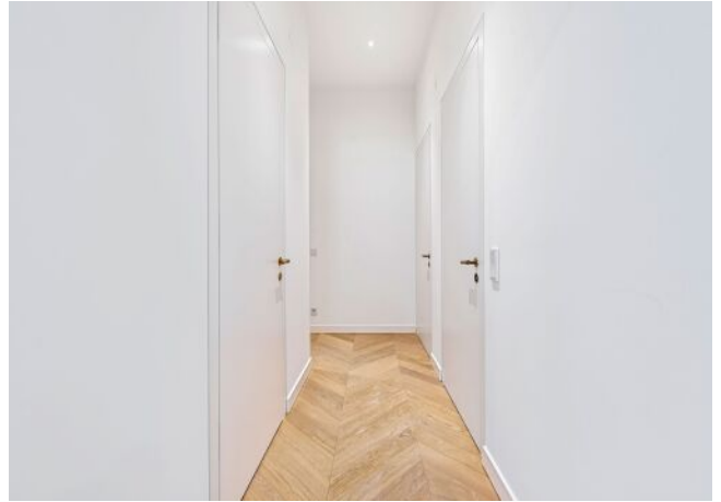
The Fusion | Vorraum