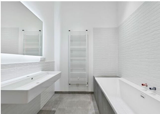
The Fusion | Bad