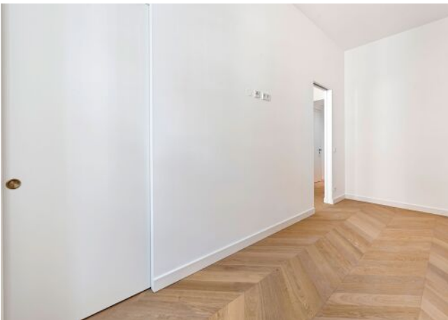
The Fusion | Zimmer