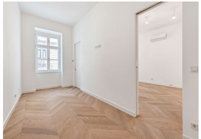
The Fusion | Zimmer