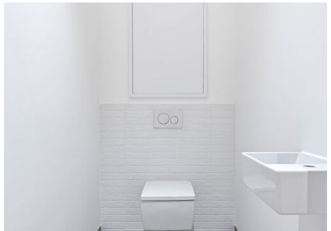
The Fusion | WC