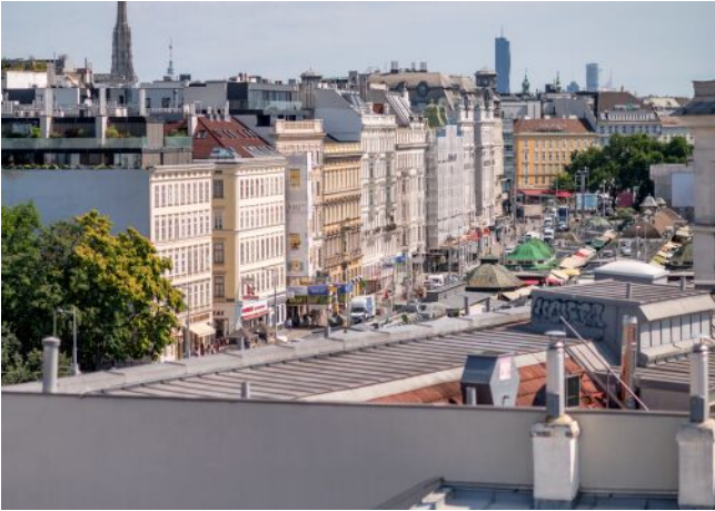
The Fusion | Naschmarkt