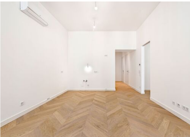
The Fusion | Wohnraum