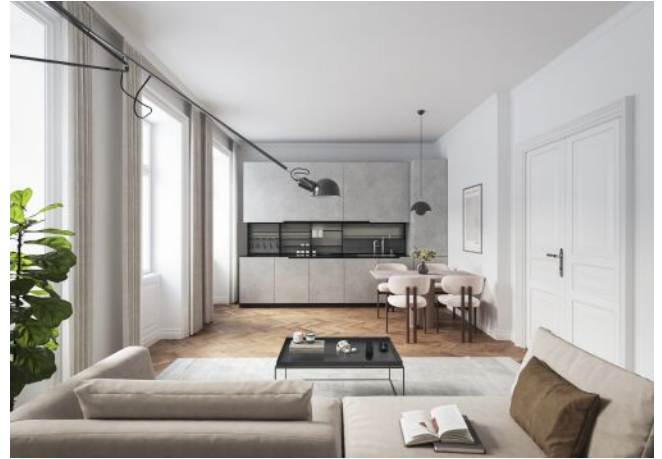
Vivienne | Wohnraum Regelgeschoss