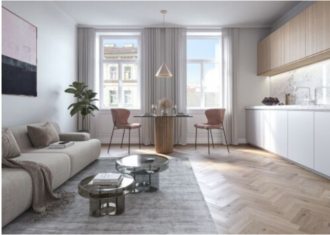
Vivienne | Wohnraum Regelgeschoss