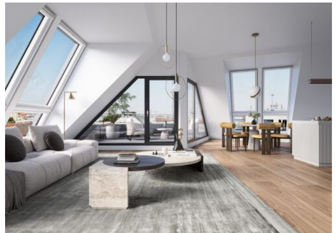
Vivienne | Wohnraum Dachgeschoss