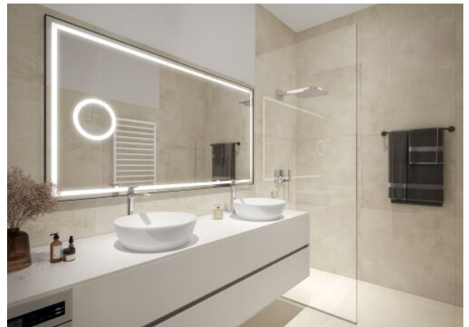
Vivienne | Badezimmer