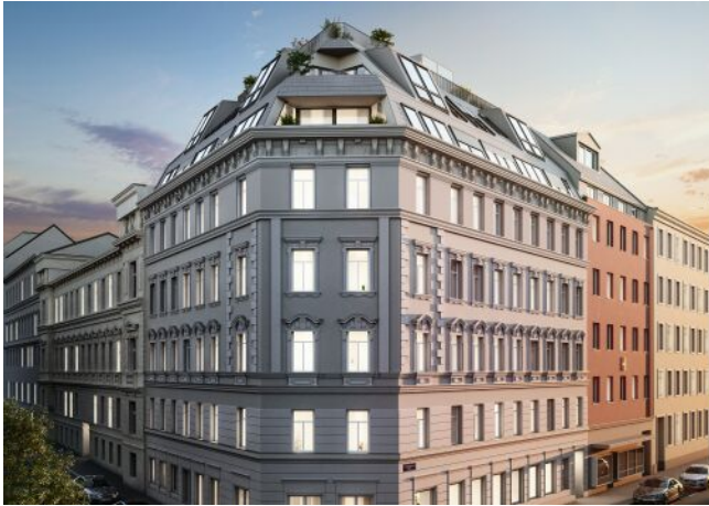
Vivienne | Fassade Nacht