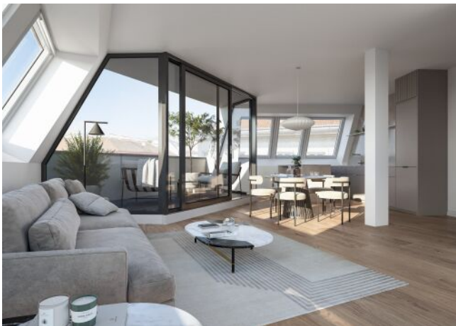
Vivienne | Wohnraum Dachgeschoss