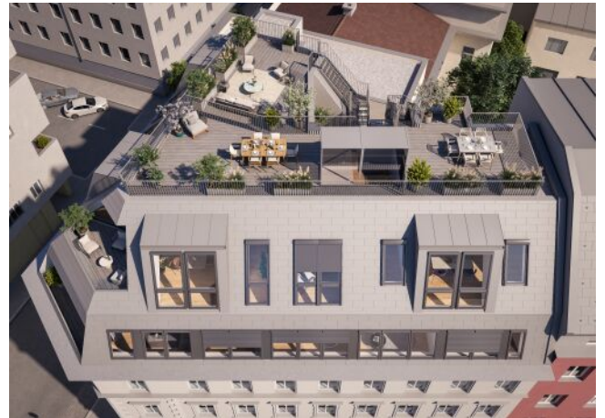
Vivienne | Fassade Tag