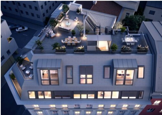
Vivienne | Fassade Nacht