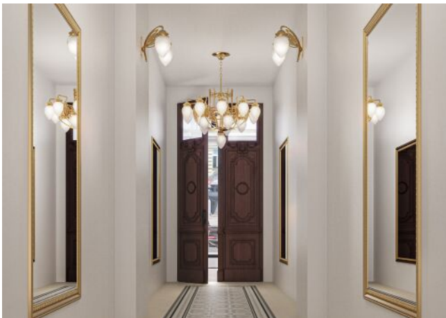
Vivienne | Hauseingang