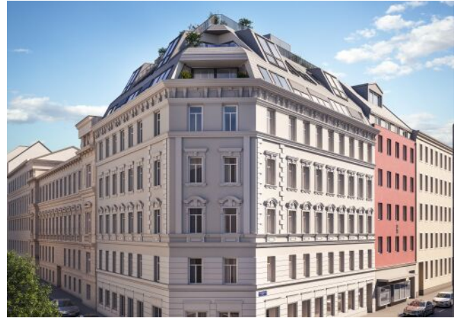
Vivienne | Fassade Tag