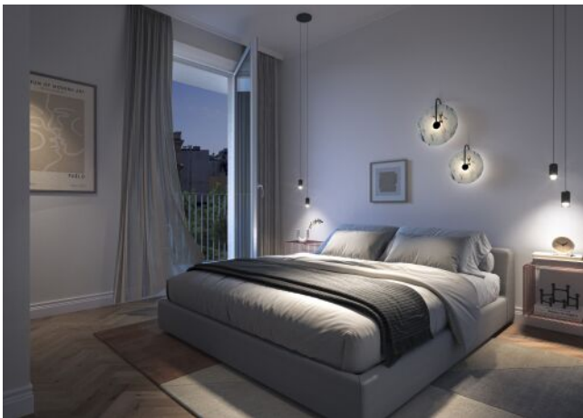
Vivienne | Schlafzimmer