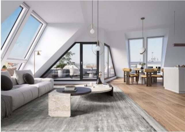
Vivienne | Wohnraum Dachgeschoss