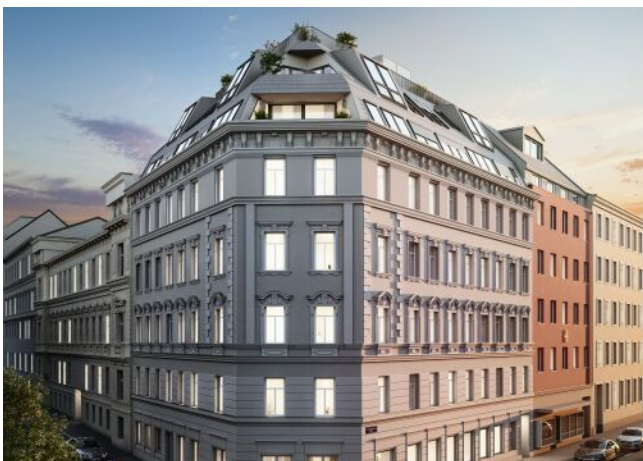
Vivienne | Fassade Nacht