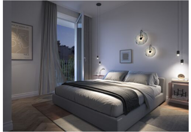
Vivienne | Schlafzimmer