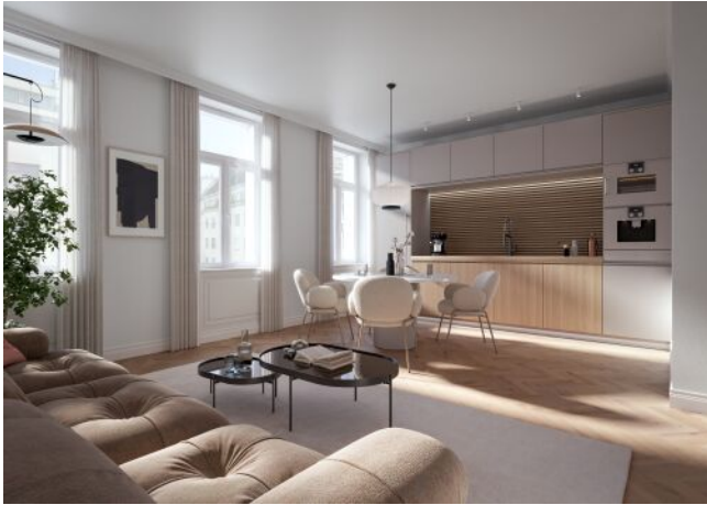
Vivienne | Wohnraum Regelgeschoss