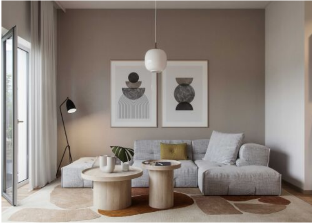
Wiedner Hauptstrasse 140 | Wohnraum