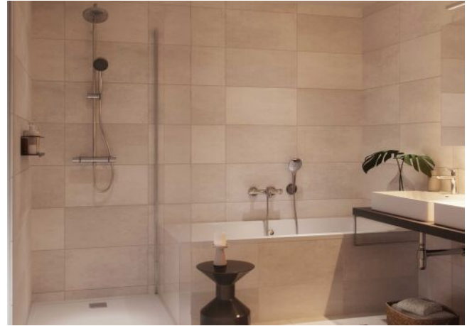
Wiedner Hauptstrasse 140 | Badezimmer