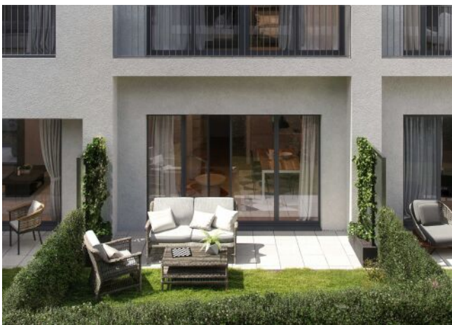
Wiedner Hauptstrasse 140 | Garten