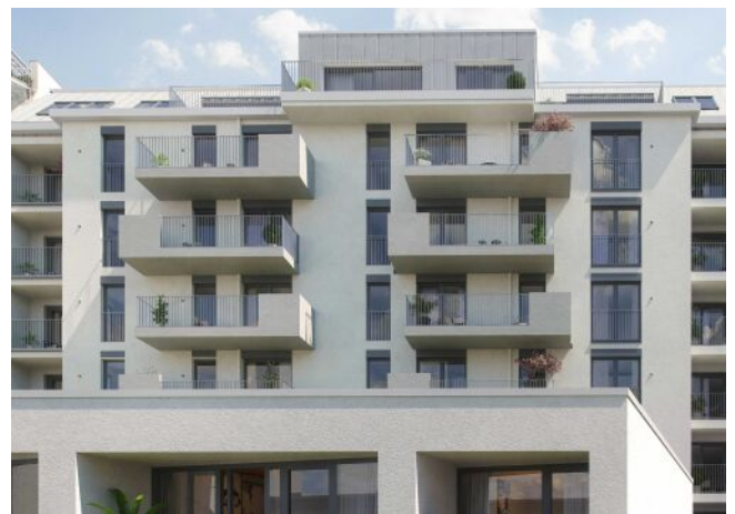
Wiedner Hauptstrasse 140 | Fassade Hof