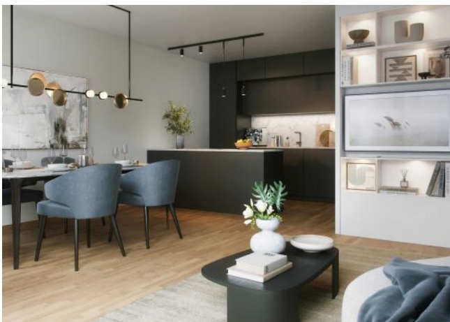
Wiedner Hauptstrasse 140 | Wohnraum