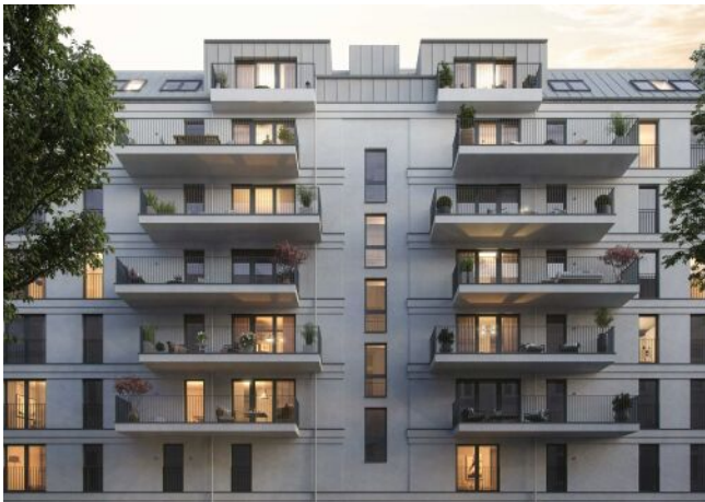
Wiedner Hauptstrasse 140 | Fassade Straße