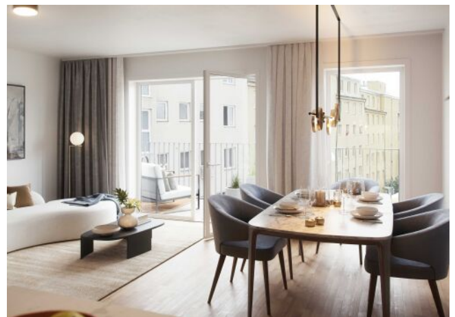
Wiedner Hauptstrasse 140 | Wohnraum