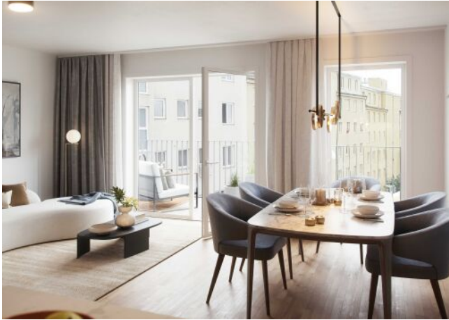
Wiedner Hauptstrasse 140 | Wohnraum