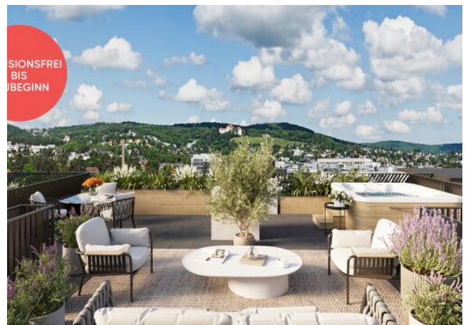
Rosegggasse | Dachterrasse