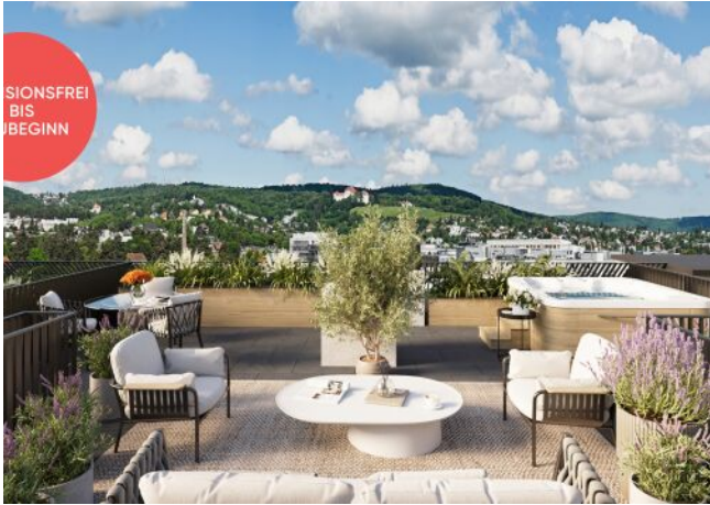
Roseggergasse | Dachterrasse