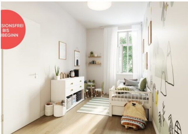
Roseggergasse | Kinderzimmer