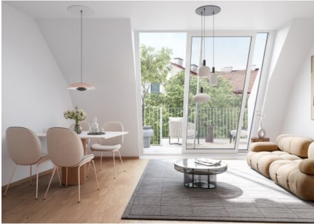
Schumannngasse | Wohnraum