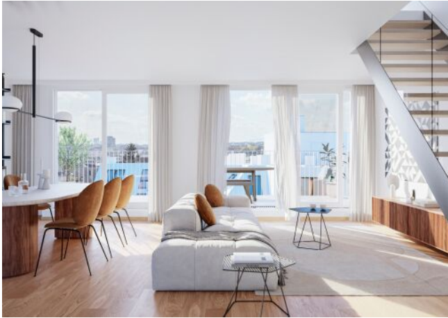
Schumannngasse | Wohnraum