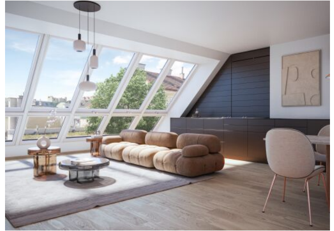
Schumannngasse | Wohnraum