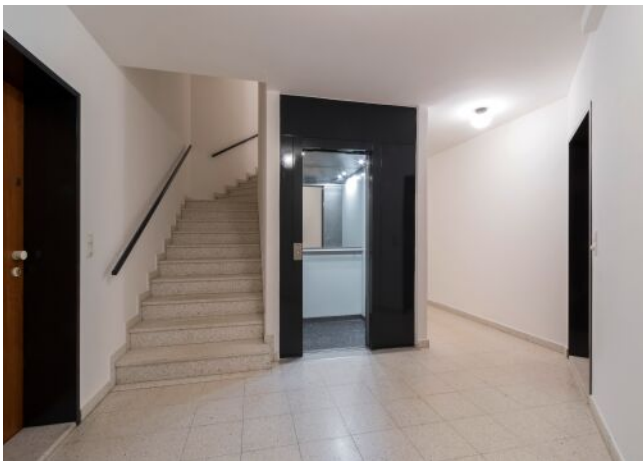
Stiegenhaus - Lift