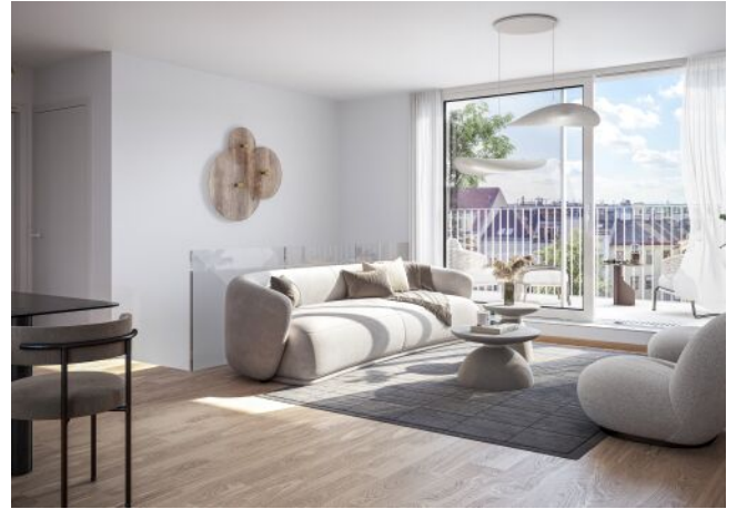
Schumannngasse | Wohnraum