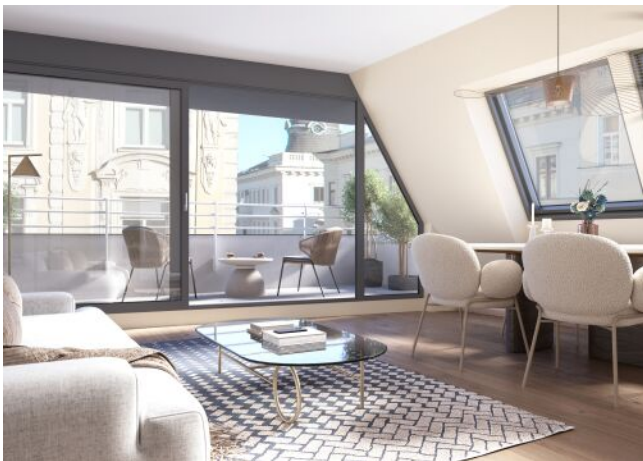
Essenz No. 1 | Schlafzimmer Dachgeschoss