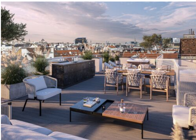
Essenz No. 1 | Dachterrasse