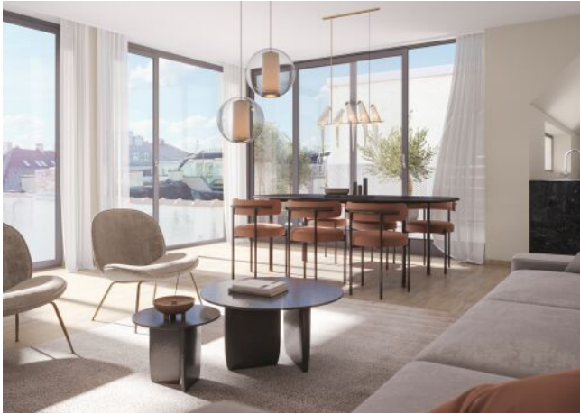
Essenz No. 1 | Schlafzimmer Dachgeschoss