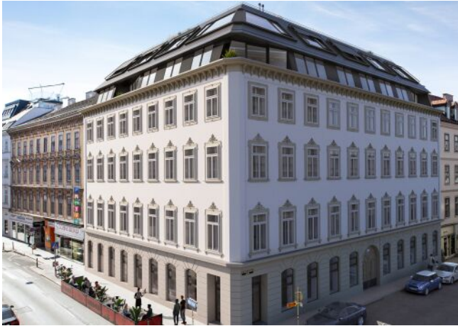
Essenz No. 1 | Fassade Tag