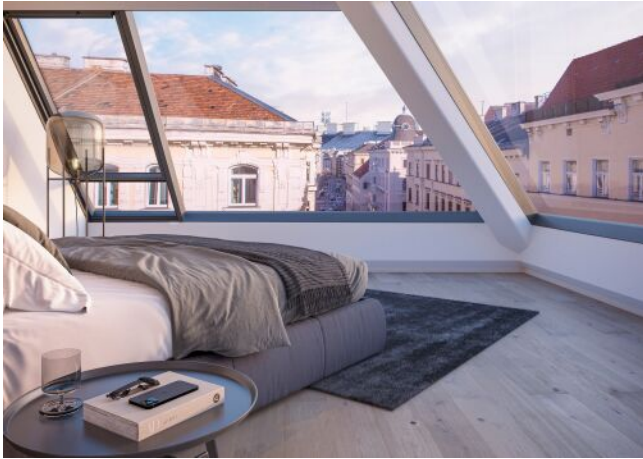
Essenz No. 1 | Schlafzimmer Dachgeschoss