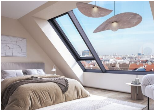
Essenz No. 1 | Schlafzimmer Dachgeschoss