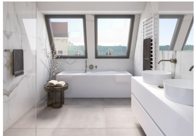
Essenz No. 1 | Badezimmer Dachgeschoss