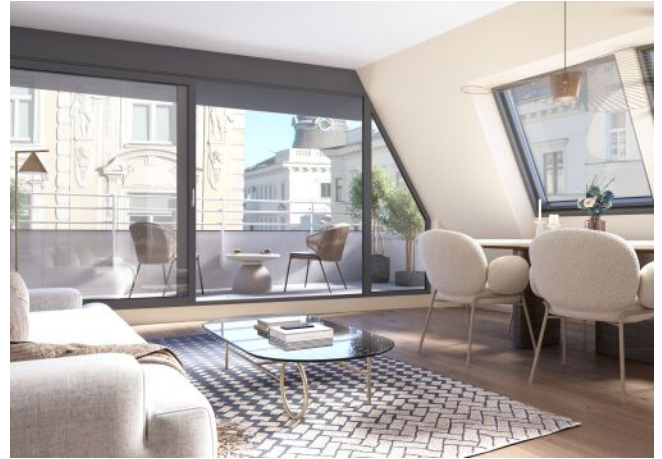
Essenz No. 1 | Wohnraum Dachgeschoss