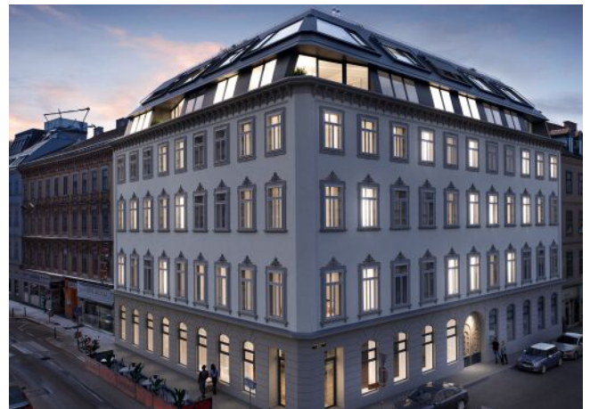
Essenz No. 1 | Fassade Abend