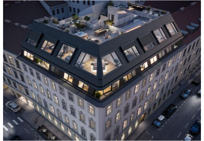
Essenz No. 1 | Fassade Oben