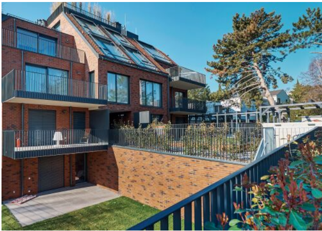
Unterer Schreiberweg 49 | Fassade