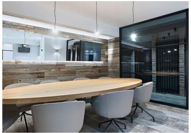
Unterer Schreiberweg 49 | Weinkeller